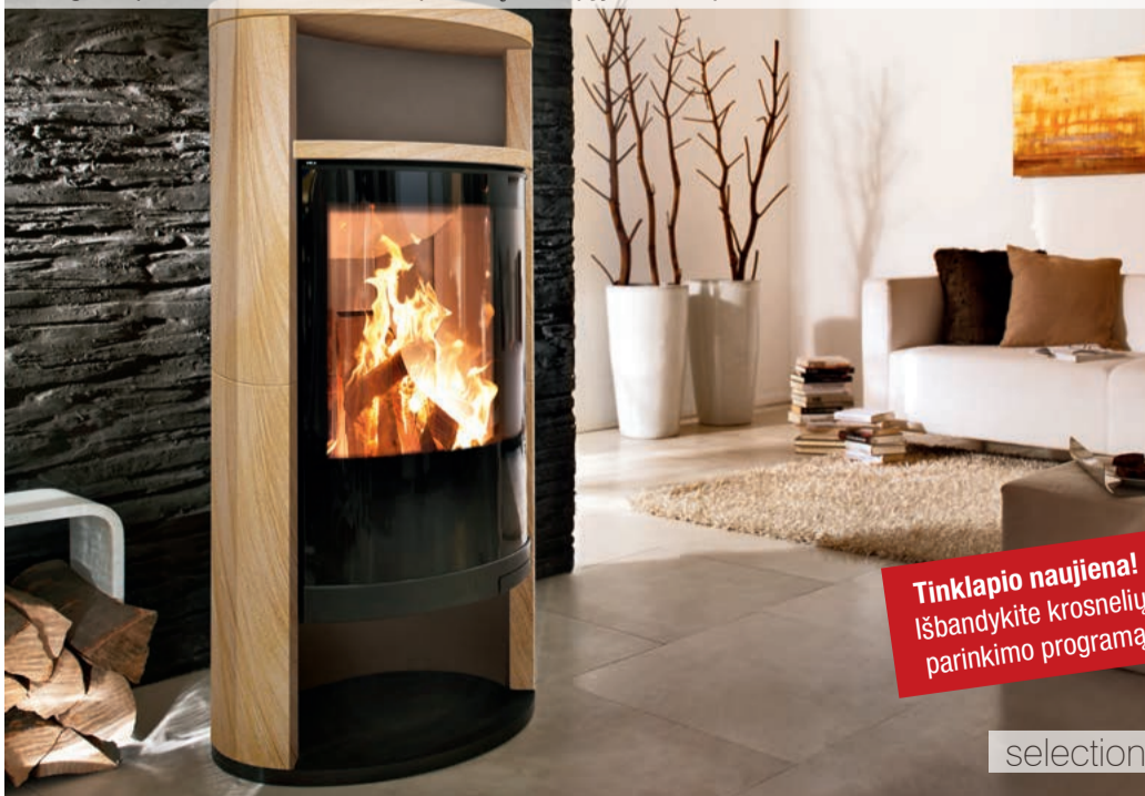
Sino L Smėlio akmuo karamelinės spalvos