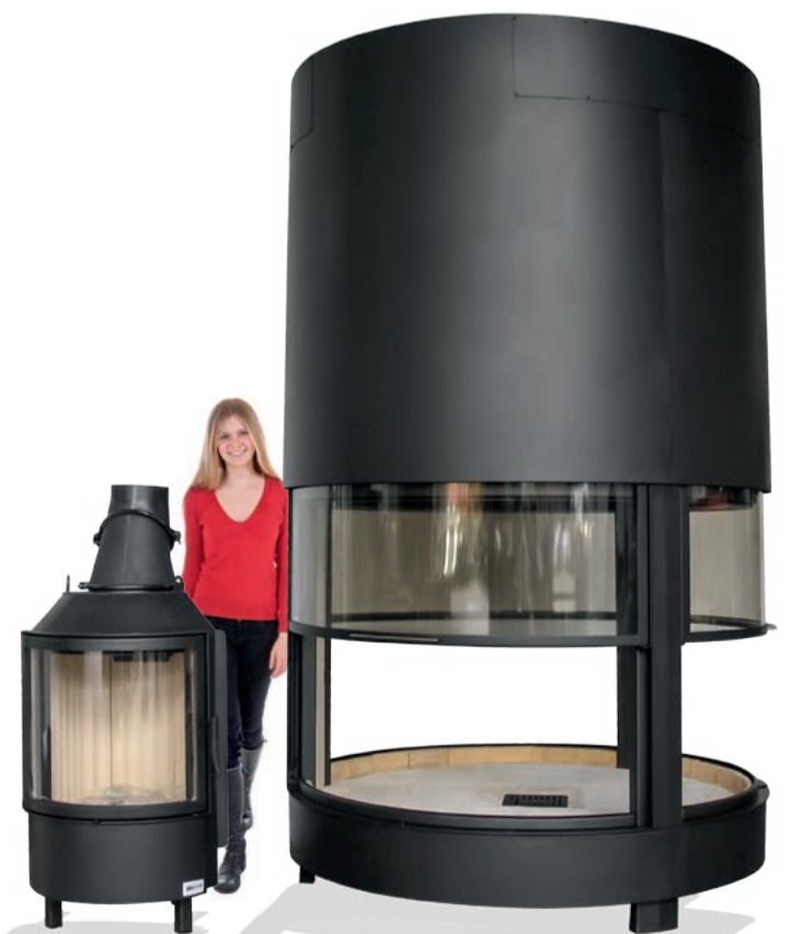
Speedy bazinis modelis | Gigant specialus dizainas

Mūsų klientų svajonės virsta realybe – pagamintas užsakymas idealiai atitinka užsakovo norus.