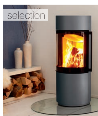
Passo XS Grafitas