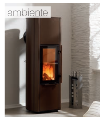
a5 Žemės spalva