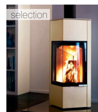
Piko S Perlo