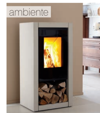
a7 Smėlio akmens klasika