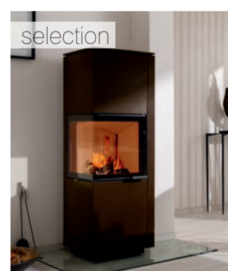
Piko H 2 O Terra